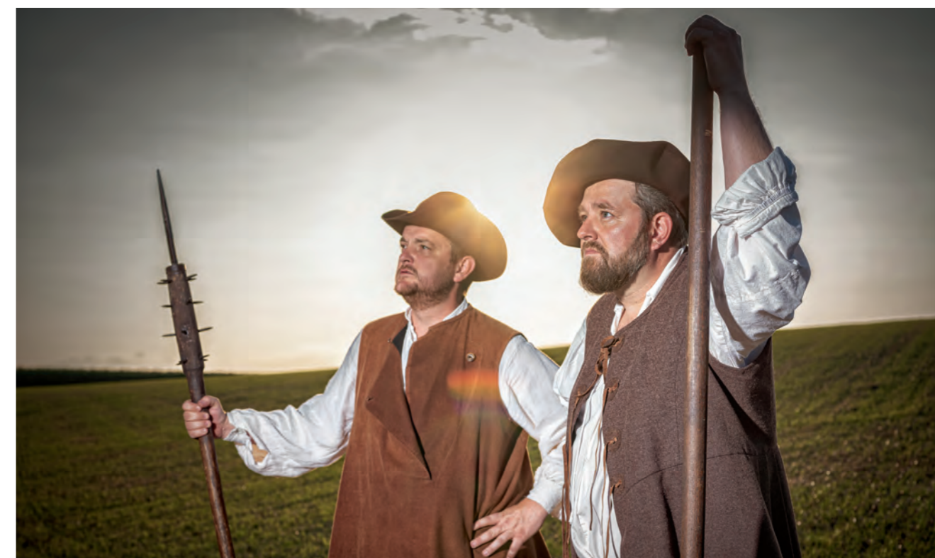
Der Bauernkrieg von 1653 wird in Hutwil eine friedliche Neuauflage erfahren. Im Juli/August 2020 wird ein Freilichtspiel die damaligen Ereignisse darstellen. Geplant sind 19 Aufführungen zwischen dem 9. Juli und 8. August.