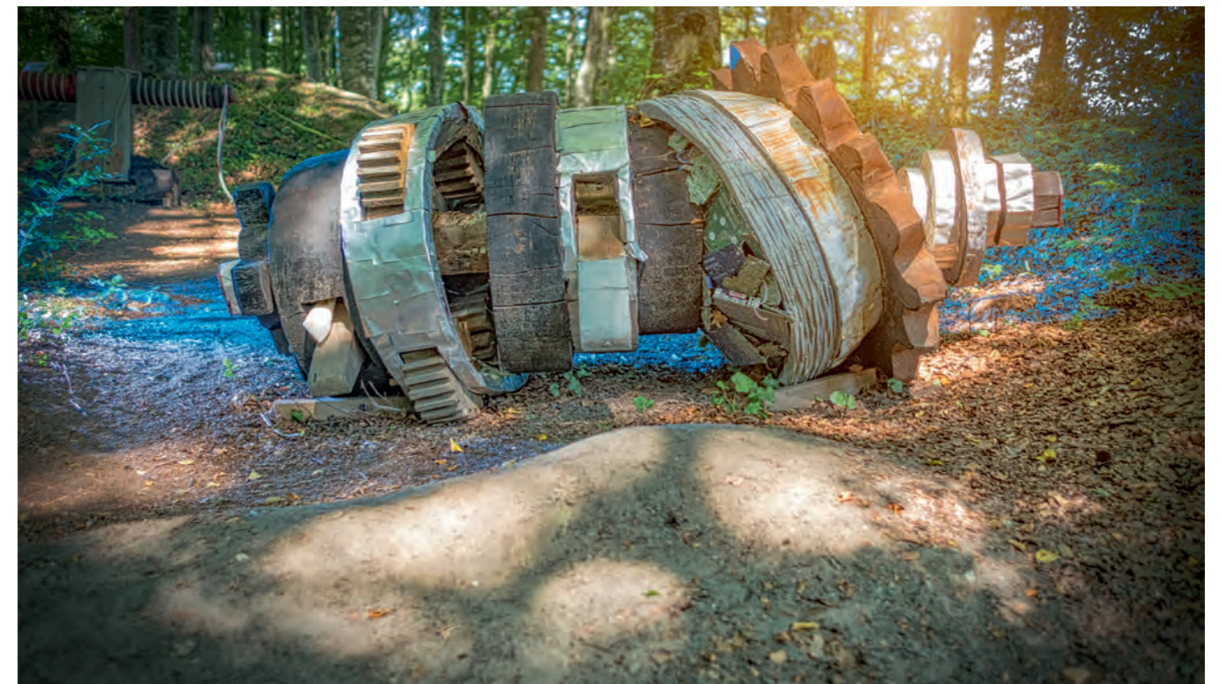
«Bewegung - Kunst - Natur» Zeitgenössische Werke und Installationen inmitten malerischer Landschaft, mit historischer Kulisse der Burgruinen Langenstein und Grünenberg.