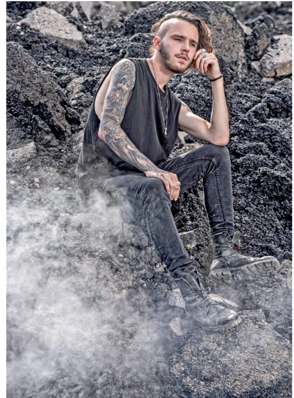
A Camera Is A Save Button For The Mind's Eye

www.rolfsutter.com | www.holymoly.ch | www.fotografica.ch