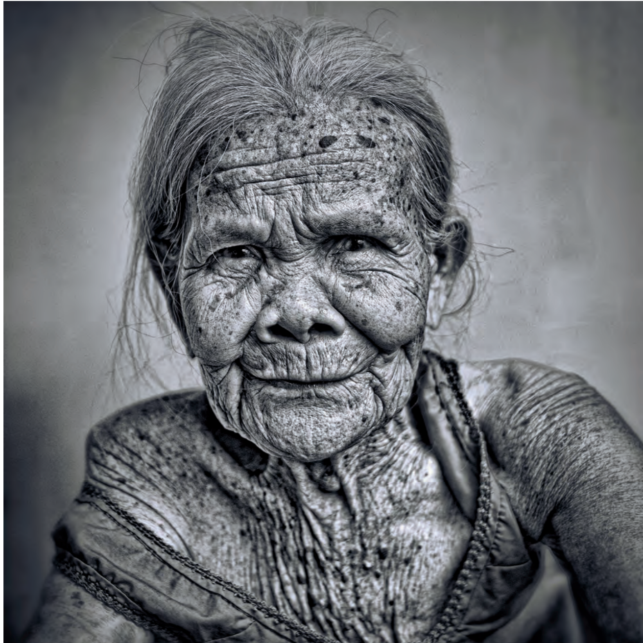
CAP COMPETITION 2017 Gold Medal