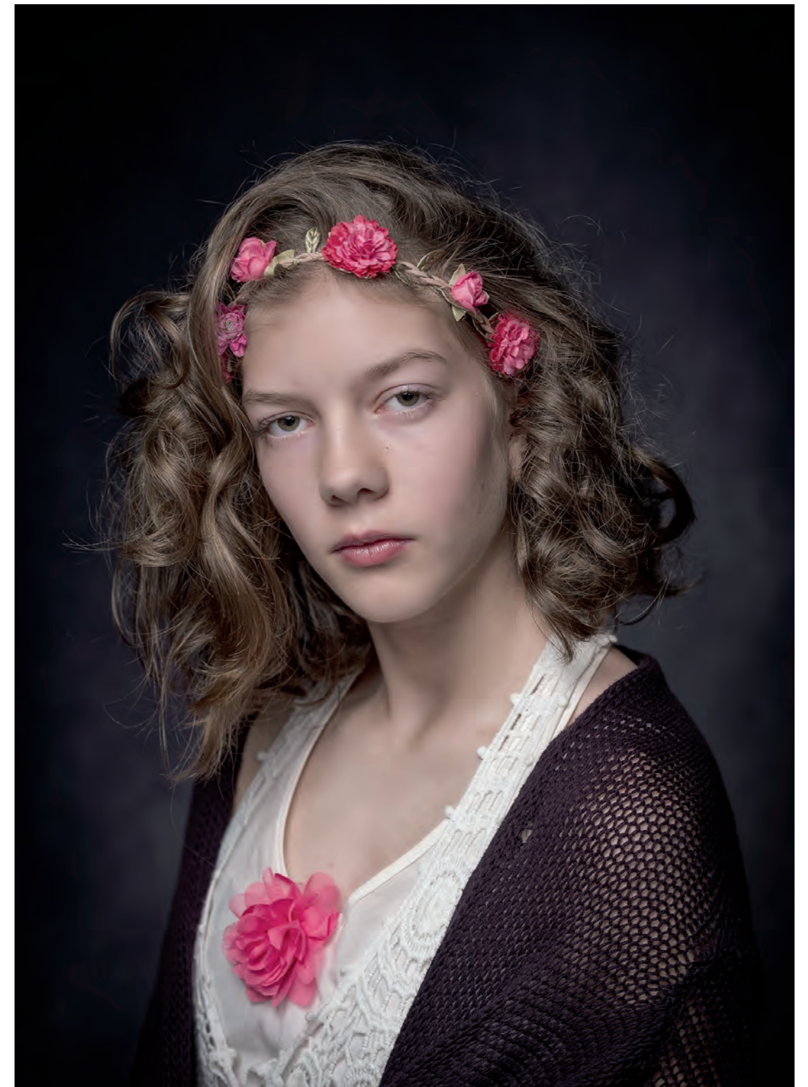
Projekt in Arbeit "Anker"