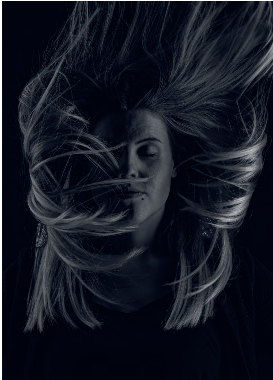
Projekt in Arbeit "HAIR"